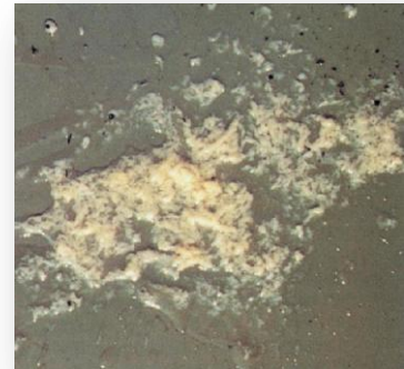
Vlokken in de melk

De melk ziet er abnormaal uit: vlokken, waterig, ... Het aangetaste kwartier kan gezwollen, hard, pijnlijk ... zijn. De algemene ziektesymptomen variëren zeer sterk gaande van afwezigheid van ziekte tekens, over koorts en eetlustdaling, tot shock en soms zelfs sterfte.